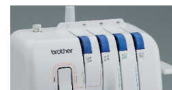
Guías de enhebrado a color